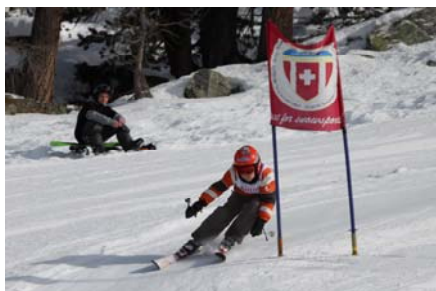
Konzentriert am Rennen