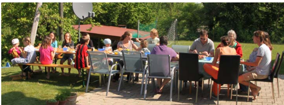
Illustre Gästeschar zum legendären Osterbrunch