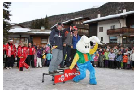
Voller Stolz nach dem Rennen